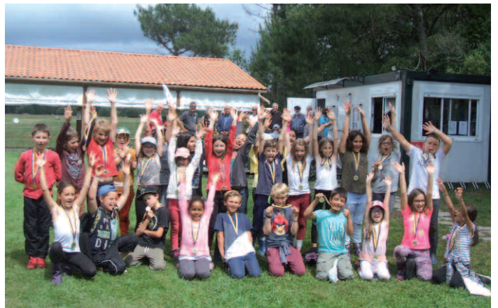
Les enfants de CE2-CM1 du regroupement pédagogique des écoles de GRAYAN, TALAIS et VENSAC.

Plusieurs manifestations sont prévues cette année sur le Practice de GRAYAN : trois journées golfigues (compétition amicale, remise de prix et repas sous la tente) en mai, juillet et août et une nocturne en septembre. Une compétition de classement a eu lieu le 15 juin sur le golf Blue Green de LA MEJANNE à LACANAU et le trophée BALATA se déroulera début septembre sur le Garden Golf de LACANAU.