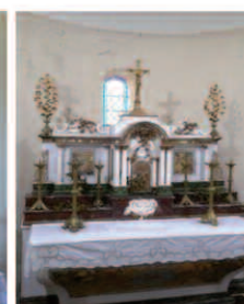
avant l'autel après

Contact : lesamidelachapelle33@gmail.com Site internet : http://amischapellehopital.blogspot.fr/ Téléphone : 06 72 67 44 28 - 06 31 74 06 70 Office du Tourisme : 05 56 09 86 61 - 05 56 03 21 01